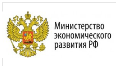
Министерство экономического развития РФ www.economy.gov.ru/material/departments/d04/