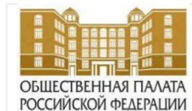
Общественная Палата РФ www.oprf.ru/structure_list/39